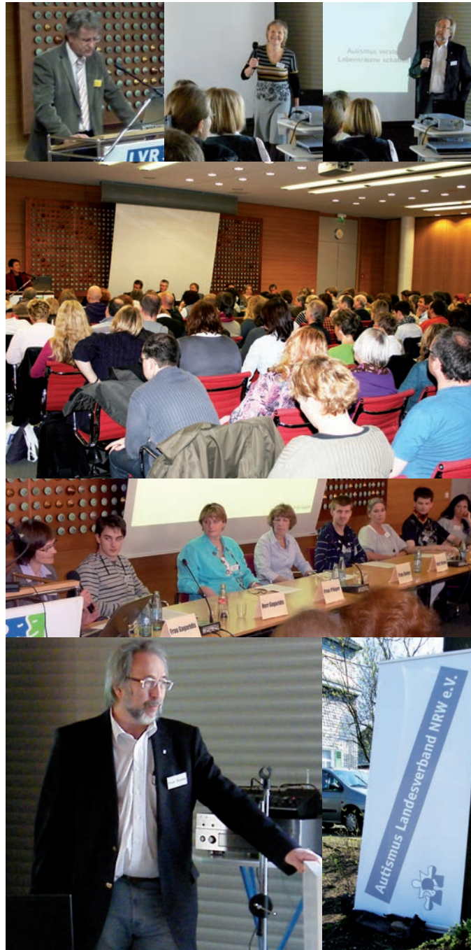
Fachtagungen des Autismus-Landesverbands anlässlich des jährlichen Welt-Autismus-Tages